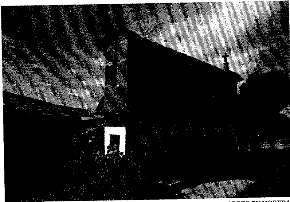
HORREO EN MOREDA